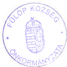
Hütóczki Péter polgármester